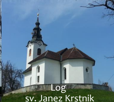
Log sv. Janez Krstnik