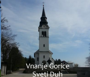
Vnanje Gorice Sveti Duh