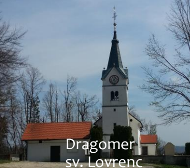
Dragomer sv. Lovrenc