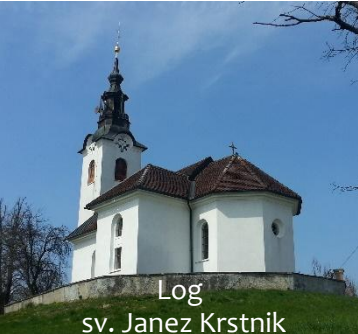
Log sv. Janez Krstnik