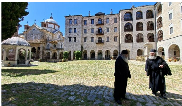
Dvorišče samostana Zograf, v katerem so pretežno menihi iz Bolgarije.

Atos je približno 50 kilometrov dolg in do 10 kilometrov širok polotok na severovzhodu Grčije, poraščen z gostimi gozdovi in izrazito hribovitim terenom. Na njegovem skrajnem koncu se dviga gora Atos, ki doseže 2033 metrov višine. Polotok je znan tudi pod imenom »Sveta gora«, kar uporabljajo številni jeziki pravoslavne tradicije, med njimi bolgarščina, makedonščina in srbsčina. Njegova zgodovina krščanske navzočnosti sega vsaj v 9. stoletje, meniška tradicija pa se je skozi stoletja neprekinjeno razvijala do danes.