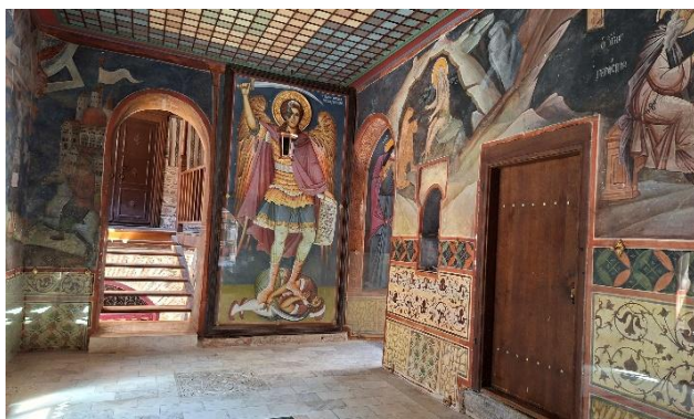
Stenske poslikave hodnika grškega samostana Dohiar s sliko sv. nadangela Mihaela, ki stoji na premaganem napadalcu, po končanem turškem plenjenju v 16. stoletju.

Na Atosu danes živi približno 2000 menihov iz različnih pravoslavnih držav – iz Grčije, Romunije, Moldavije, Gruzije, Bolgarije, Srbije, Rusije in drugih. Živijo v strogi askezi, odmaknjeni od zunanega sveta, v ritmu molitve, dela in bogoslužja. Na polotoku je dvajset velikih samostanov, ki hranijo izjemno bogate zbirke rokopisov, starih knjig, ikon in umetnin neprecenljive zgodovinske vrednosti. Od leta 1988 je Atos uvrščen tudi na Unescov seznam svetovne dediščine. Posebnost je tudi njegova upravna ureditev: čeprav je