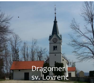
Dragomer sv. Lovrenc