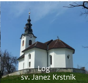
Log sv. Janez Krstnik