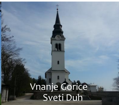
Vnanje Gorice Sveti Duh