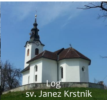
Log sv. Janez Krstnik