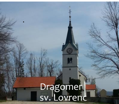
Dragomer sv. Lovrenc