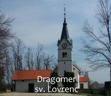
Dragomer sv. Lovrenc