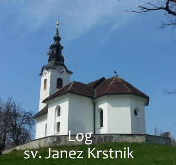
Log sv. Janez Krstnik