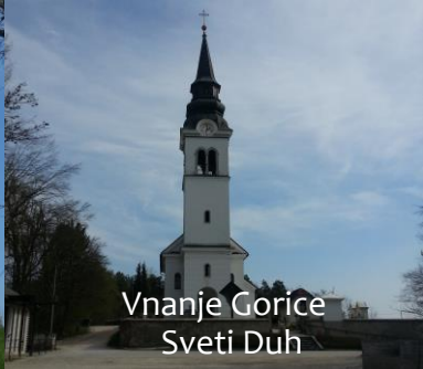
Vnanje Gorice Sveti Duh