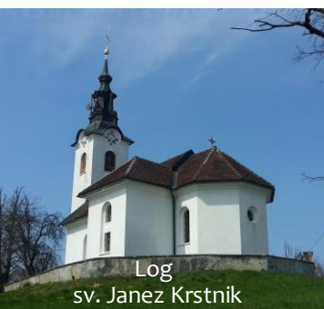
Log sv. Janez Krstnik