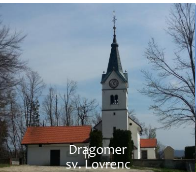
Dragomer sv. Lovrenc