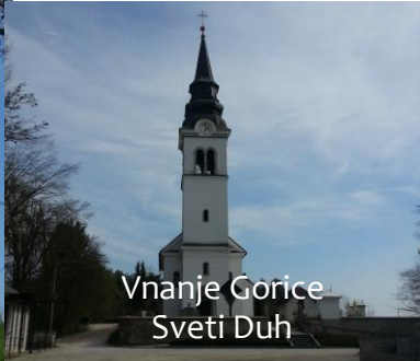
Vnanje Gorice Sveti Duh