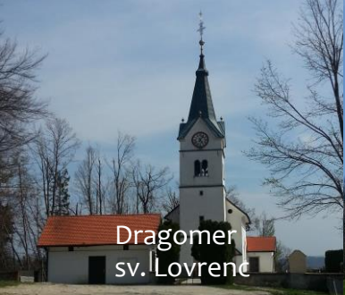
Dragomer sv. Lovrenc