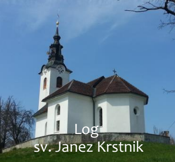
Log sv. Janez Krstnik