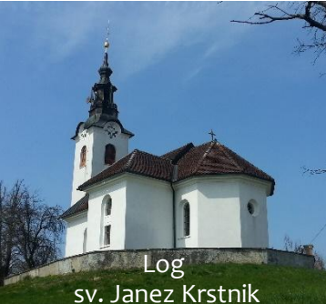
Log sv. Janez Krstnik