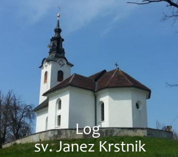
Log sv. Janez Krstnik