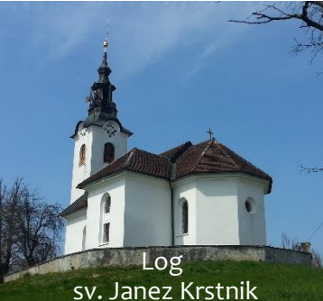
Log sv. Janez Krstnik