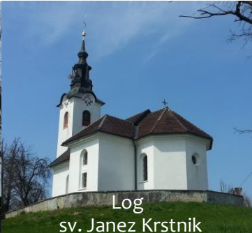
Log sv. Janez Krstnik