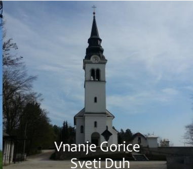
Vnanje Gorice Sveti Duh