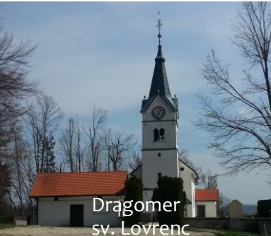
Dragomer sv. Lovrenc