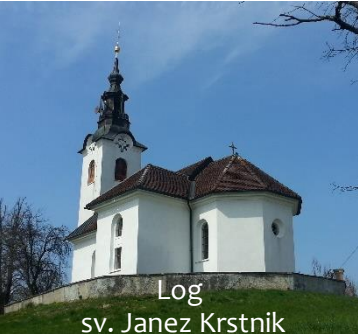
Log sv. Janez Krstnik