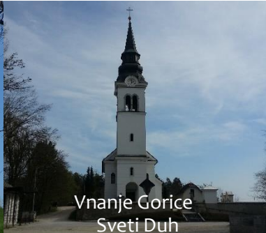
Vnanje Gorice Sveti Duh