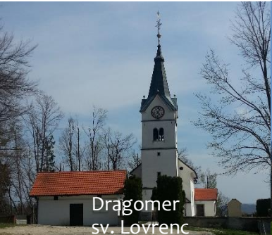
Dragomer sv. Lovrenc