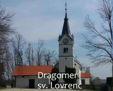
Dragomer sv. Lovrenc