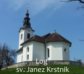
Log sv. Janez Krstnik