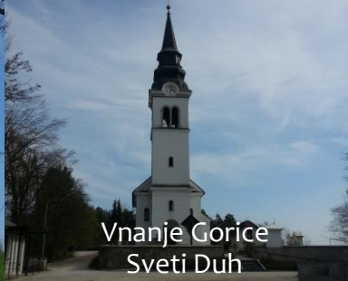
Vnanje Gorice Sveti Duh